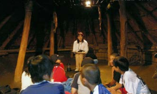
竪穴式住居に泊まる!